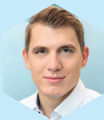
Andreas Blom Vertrieb M-Files