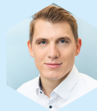
Andreas Blom Vertrieb DMS